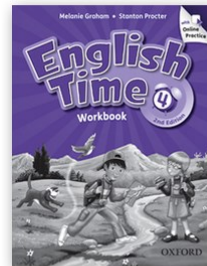
English Time Level 4 Expires: May 04, 2017